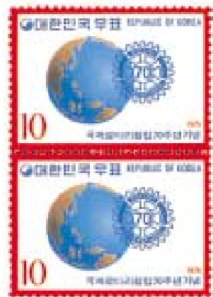
국제로타리 창립 70주년 기념우표 (1975. 2. 23.)