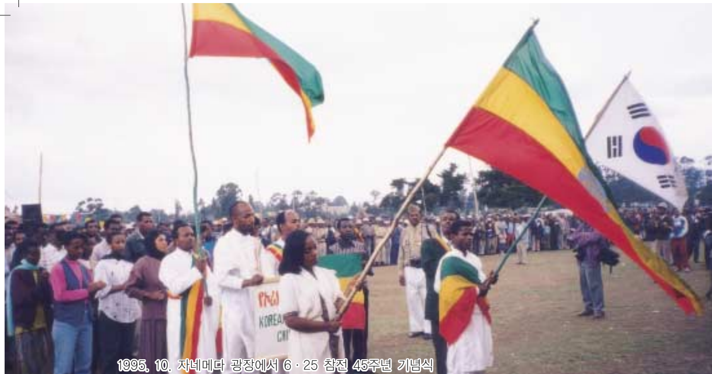
1995. 10. 자네메다 광장에서 6·25 참전 45주년 기념식