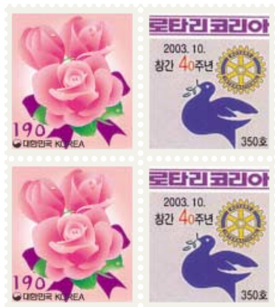
로타리코리아 창간 40주년 기념우표 (2003. 10. 30.)