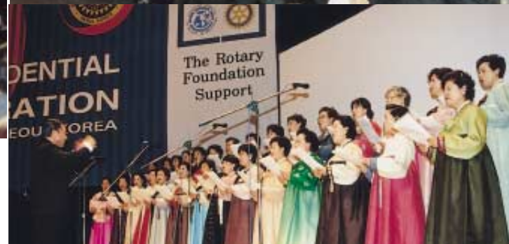
▲ 3650지구 서울코러스RC 합창단 축하 ▼ 마지막베 RI회장 세종대 명예 법학박사학위 수여

한편 경축행사 당일 기부약정금액이 83만 1,000달러, 즉석 성금동의로 800여만 원의 아데 장학금이 모금됐다.