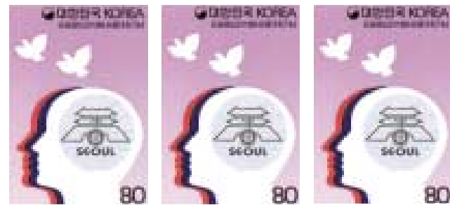
제80차 서울국제대회 기념우표 (1989. 5. 21.)