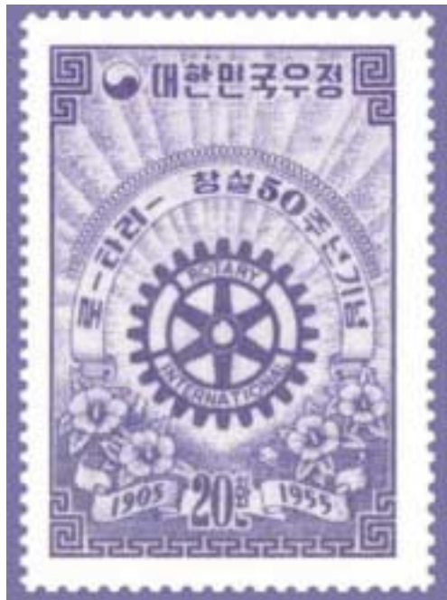
국제로타리 창립 50주년 기념우표 (1955. 2. 23.)