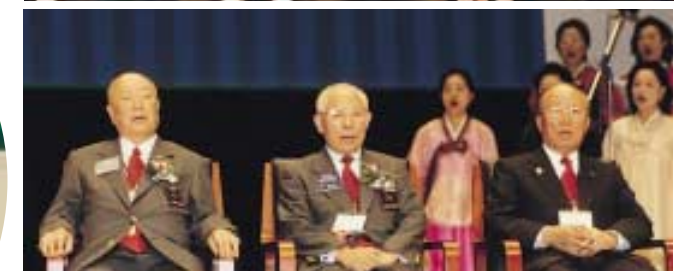
▲ (위 왼쪽부터) 이동건 로타리 재단관리위원, 킨로스 전재단관리위원장, 마지막베 RI회장, (아래 왼쪽부터) 고조 수고 RI이사, 사쿠지 다나카 RI이사, 배도 RI회장 경축행사 서울대회 위원장 ▼ 손에 손잡고 폐막식