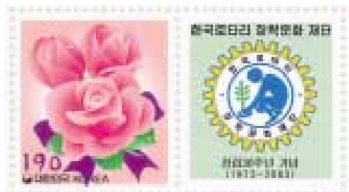
한국장학문화재단 창립 30주년 기념우표 (2003. 2. 26.)