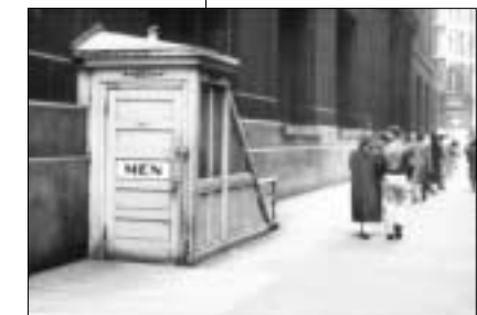
로타리 최초의 프로젝트인 공중 화장실설치로 지역사회 및 인도주의 봉사를 시작