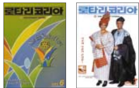
2003, 6월호(통권346호) 2003, 7월호(통권347호)