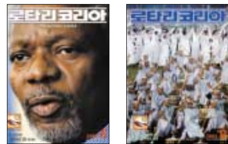
2003, 8월호(통권348호) 2003, 9월호(통권349호)