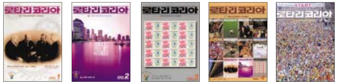
2003, 1월호(통권341호) 2003, 2월호(통권342호) 2003, 3월호(통권343호) 2003, 4월호(통권344호) 2003, 5월호(통권345호)